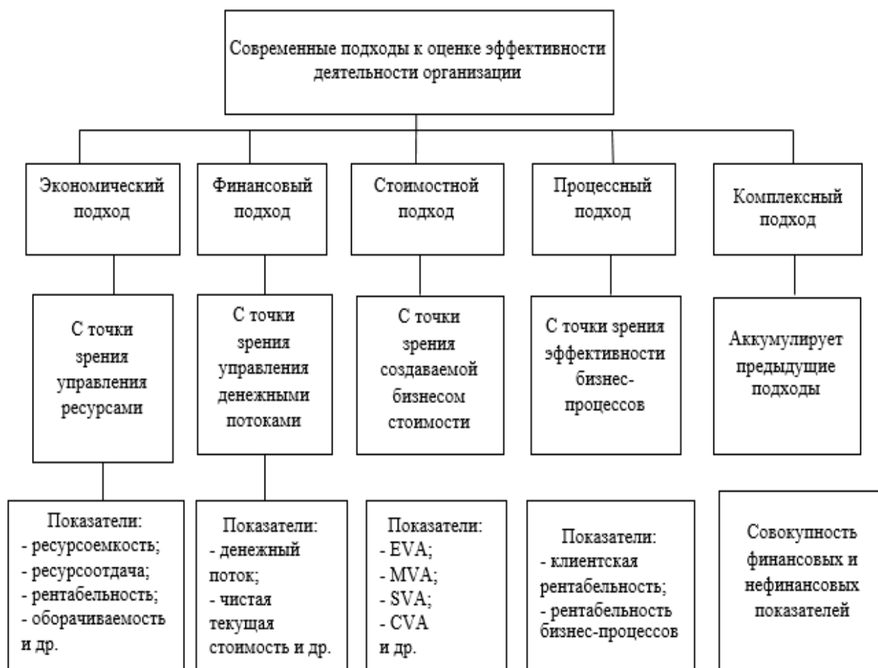
Рис. 2. Методические подходы к оценке эффективности деятельности

На следующем этапе исследования рассмотрим существующие на сегодняшний день подходы к оценке эффективности деятельности организации (рис.2). «Выделяют пять методических подходов к оценке эффективности деятельности организаций: экономический, финансовый, стоимостной, процессный и комплексный» [4].