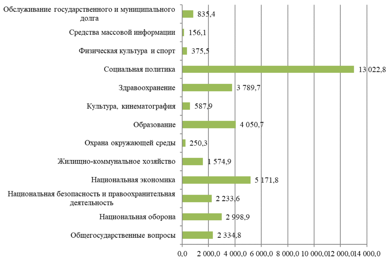
Рис. 1. Структура расходов консолидированного бюджета РФ в 2019 г., млрд руб.*

Анализируя динамику расходов консолидированного бюджета РФ, можно заметить, что существенным изменениям она не подверглась (табл. 1), однако стоит отметить увеличение затрат таких показателей как «Охрана окружающей среды» (на 115,3% в 2019 г. в сравнении с 2018 г.) и «Национальная экономика» (на 19,4%), возникших в связи с исполнением национальных и федеральных проектов на уровнях субъектов Российской Федерации.