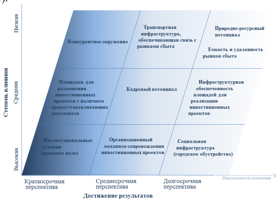
Рис. 4. Условия хозяйствования муниципальных образований с ТОР (распределены в зависимости от степени влияния на их изменение деятельности органов власти посредством мер регулирования и горизонта достижения результатов по показателям каждой группы)

Каждое из условий требует исчерпывающего анализа и оценки многих параметров в виде показателей. Например, по критерию «кадровый потенциал» территории – уровень безработицы; доля экономически активного населения; доля работников со средним специальным и высшим образованием и другие. Представим распределение обозначенных условий территории муниципального образования по степени влияния деятельности органов власти и горизонтам достижения существенных улучшений параметров, характеризующих эти условия (см. рис. 4).