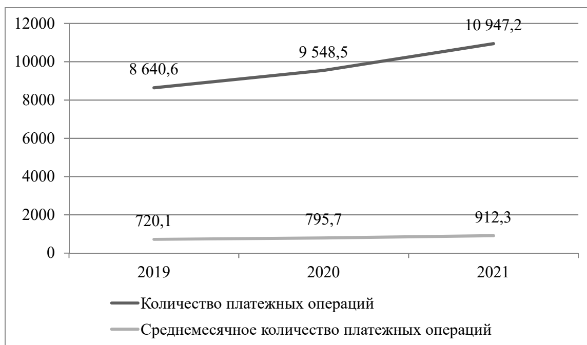
Рис. 2. Количество осуществленных Управлением Федерального казначейства по Иркутской области в период 2019–2021 гг. платежных операций по учету поступлений и их распределению между бюджетами бюджетной системы Российской Федерации, тыс.*

Количество осуществленных Управлением Федерального казначейства по Иркутской области в период 2019–2021 гг. платежных операций по учету поступлений и их распределению между бюджетами бюджетной системы Российской Федерации имеет тенденцию к увеличению (рис. 2).