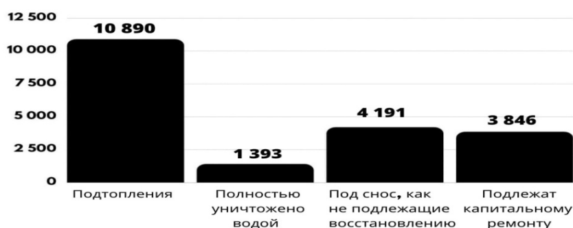
Рис. 2. Ущерб, нанесенный в результате ЧС. Оценка состояния жилых помещений*

В результате паводка была организована «Программа по восстановлению жилья, объектов коммунальной, энергетической, социальной и транспортной инфраструктуры, объектов связи, административных зданий и сооружений поврежденных или утраченных в результате наводнения на территории Иркутской области». Срок реализации 2019-2023 гг. Общая потребность финансирования составила 35,1 млрд. руб.