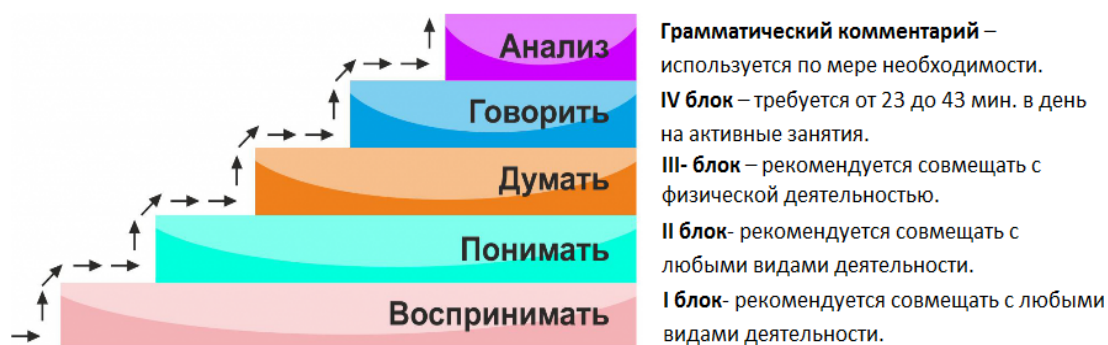
Рис.2. Каким образом происходит обучение по методуCLP

Метод CLP позволяет активизировать врожденные способности, которые присутствуют изначально, просто потому, человек может воссоздавать естественное развитие речи.