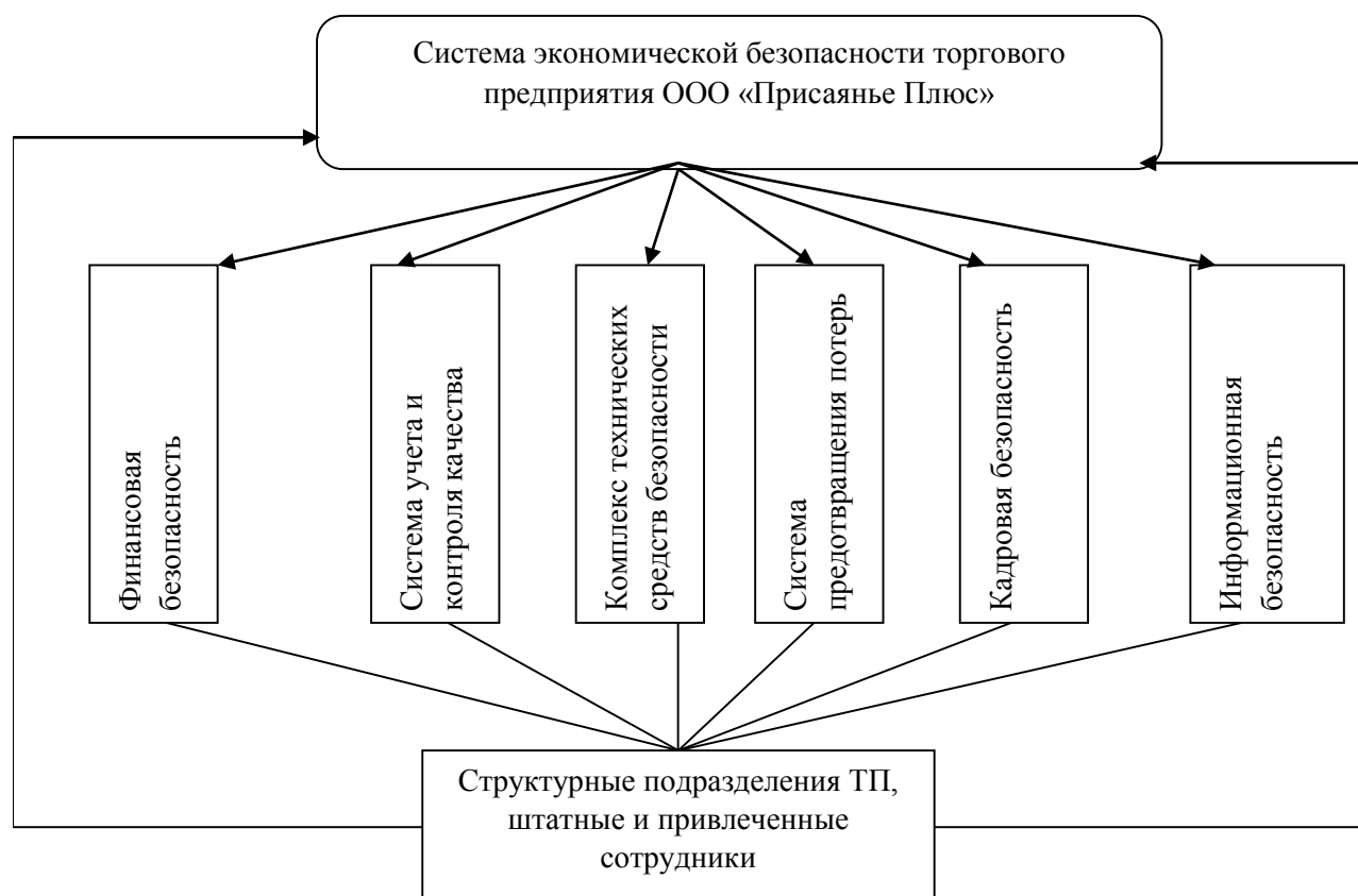
Рис. 1. Основные элементы системы экономической безопасности ООО «Присяянье Плюс» Тулунского района Иркутской области

Полученные результаты. На рисунке 1 представлены основные элементы системы безопасности торгового предприятия ООО «Присяянье Плюс».