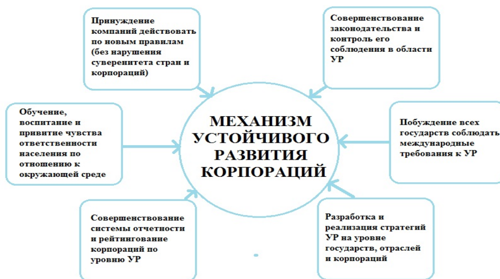
Рис. 1. Механизм устойчивого развития корпорации

Во избежание нарушений правил формируют определенный способ деятельности компании, называемый механизмом устойчивого развития (рис. 2). Его целью является преобразование деятельности, нарушающей стандарты GRI, в невыгодную. [10, с. 184]